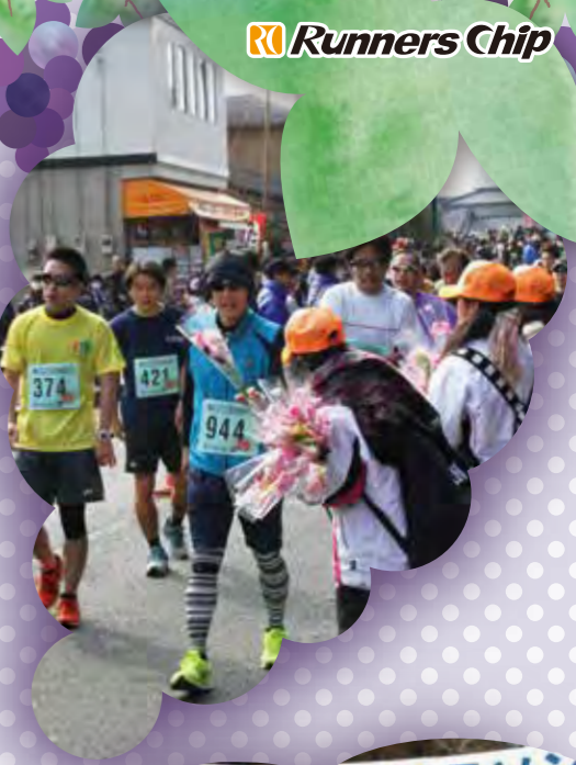
都農尾鈴マラソン